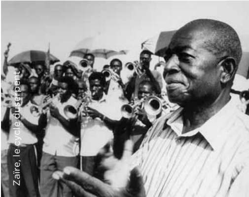
Zaire, le cycle du serpent

nl/ Regisseur, fotograaf, docent en journalist Thierry Michel begon in de vroege jaren zeventig met het draaien van televisie-reportages en al snel draaide hij ook voor het grote doek. Hij maakt enkele fictiefilms, maar toch vooral geëngageerde documentaires. Eerst registreerde hij het geïndustrialiseerde Charleroi, eind jaren tachtig komt hij in Brazilië terecht en neemt de favela's onder de loep. Het contact met zwarte cultuurgemeenschappen leidt tot het internationaal bejubelde Zaire, le cycle du serpent en, daaropvolgend, een reeks kritische films over de voormalige Belgische kolonie. CINEMATEK biedt u een overzicht van Thierry Michels 'Congofilms'.