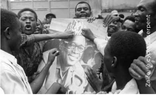
Zaire, le cycle du serpent